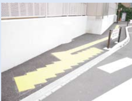
新しく敷設された武蔵野台駅前の点字ブロック駅へのアクセスにムダがなくなりました！