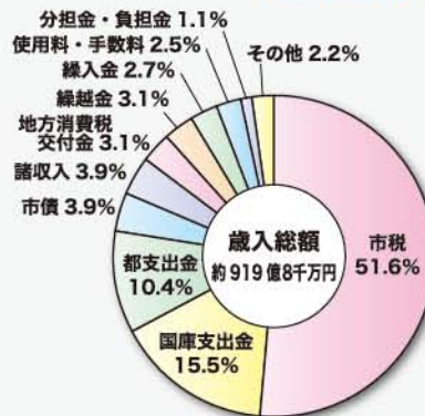
【歳入決算額詳細と構成比率】