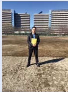
3月議会文教委員長時の新給食センター建設予定地の現地視察

また、地元晴見町の法務省関連施設の移転にも関わってくる委員会なので、大変やりがいがあります。しっかりと務めて参ります！